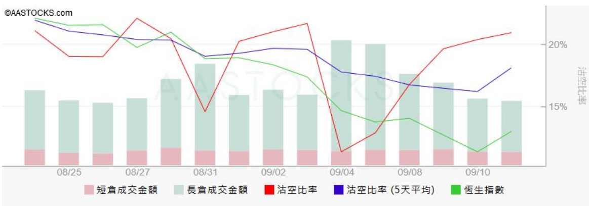
图3. aastock: 恒指沽空比率