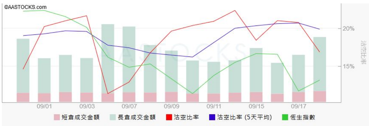
图3. aastock: 恒指沽空比率