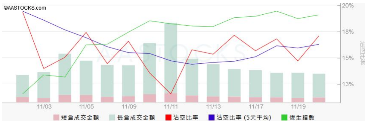
图3. aastock: 恒指沽空比率