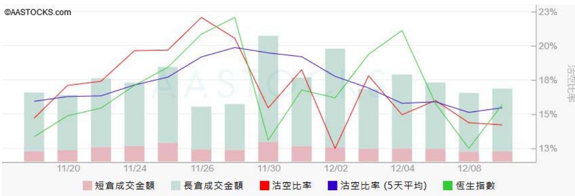
图3. aastock: 恒指沽空比率