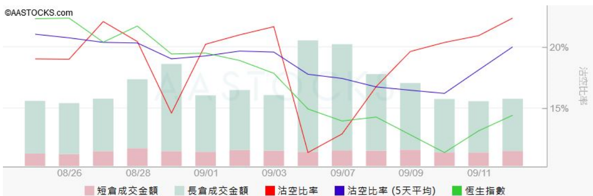
圖3. aastock: 恒指沽空比率