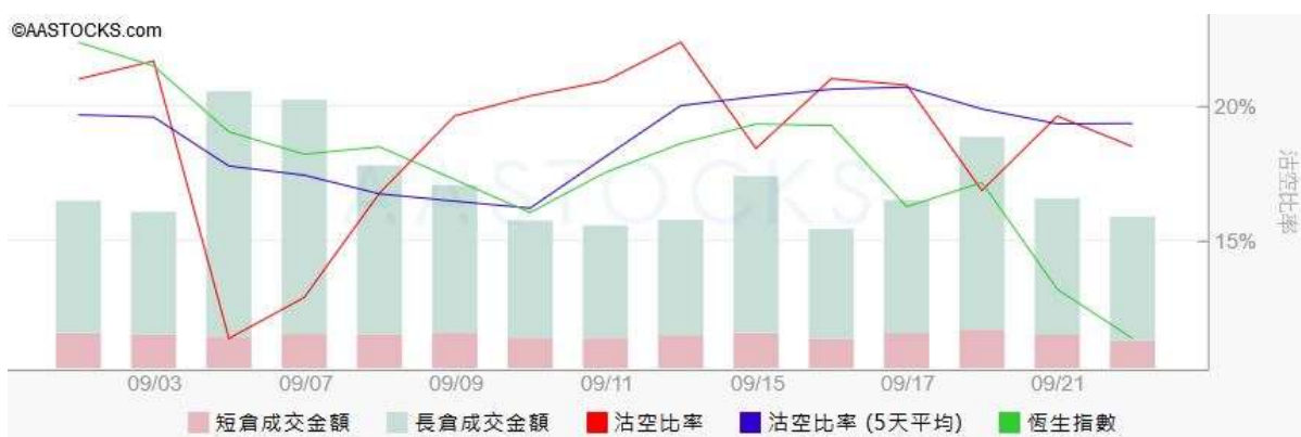
圖3. aastock: 恒指沽空比率