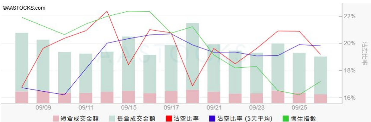
图3. aastock: 恒指沽空比率