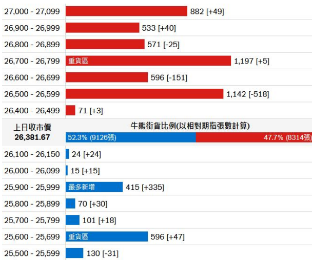
图2. 瑞信: 牛熊证街货比例及分布