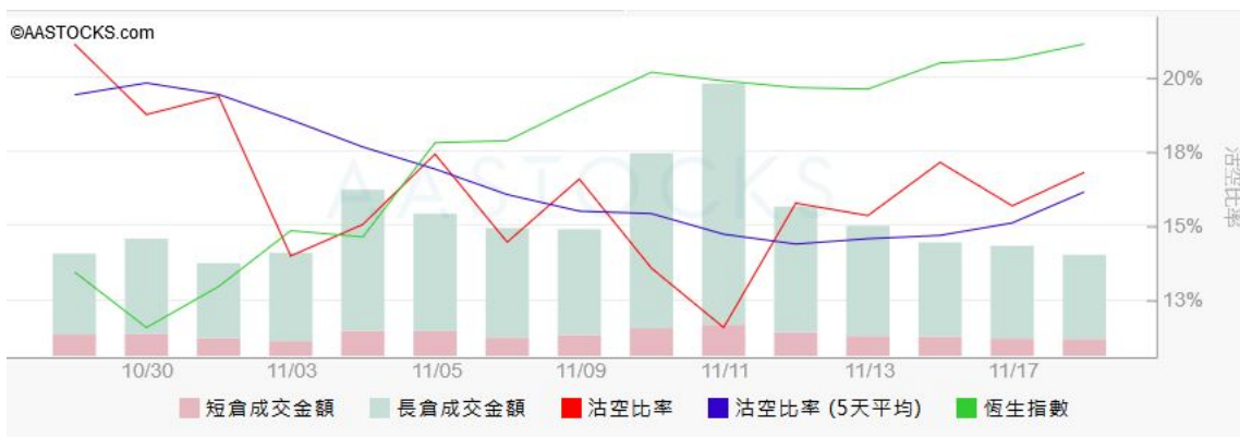
圖3. aastock: 恒指沽空比率