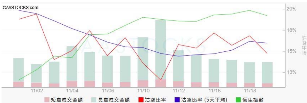
图3. aastock: 恒指沽空比率