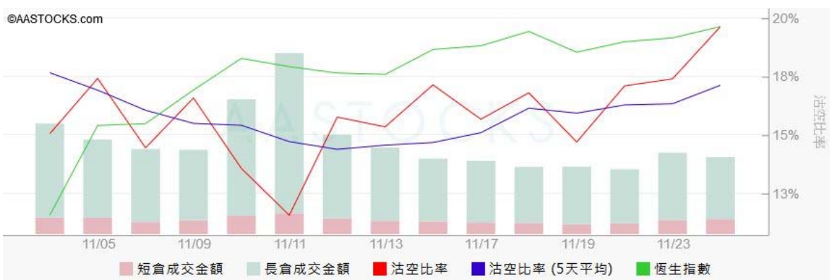
图3. aastock: 恒指沽空比率