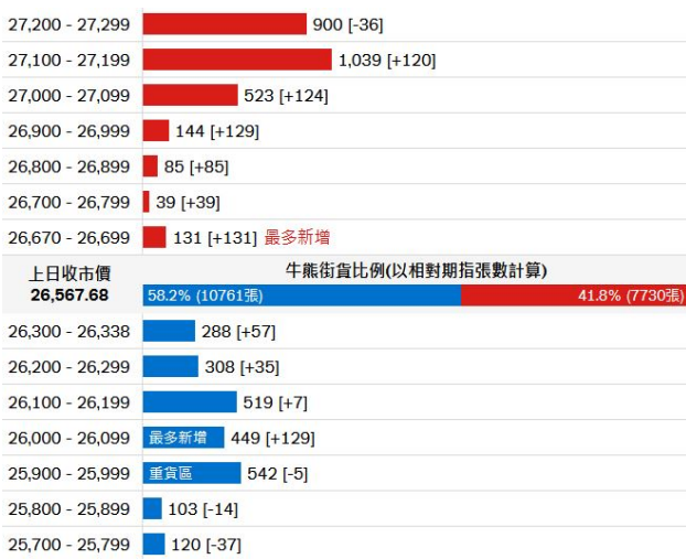
图2. 瑞信: 牛熊证街货比例及分布