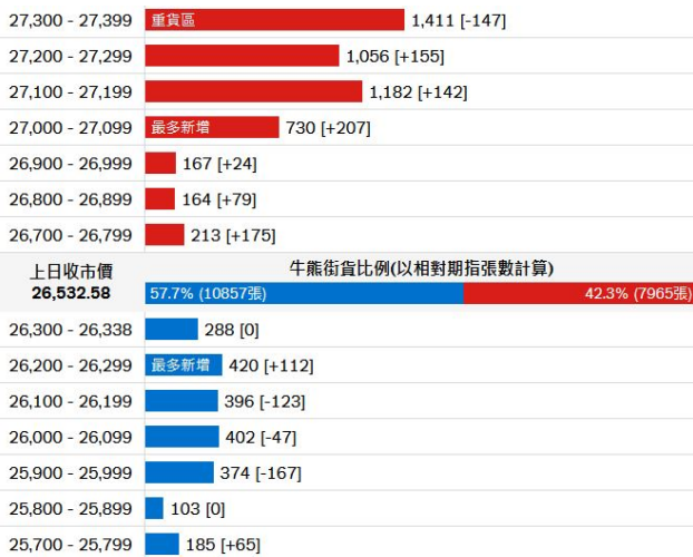
圖2. 瑞信: 牛熊證街貨比例及分佈