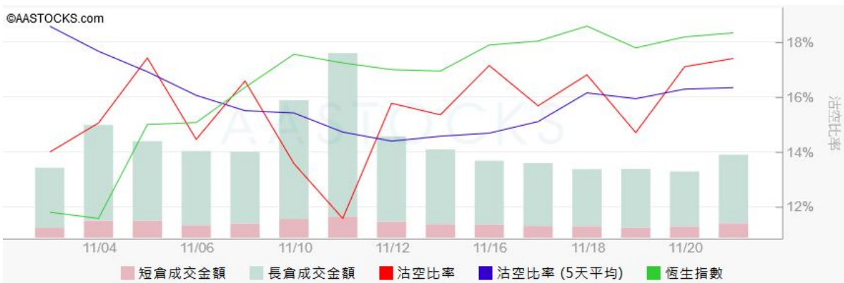
圖3. aastock: 恒指沽空比率